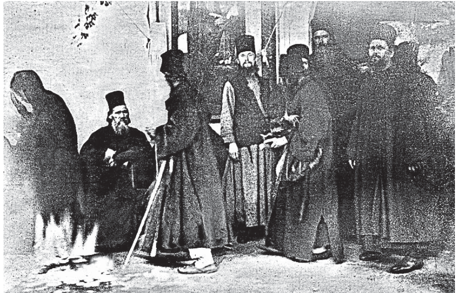
Чудо явления Божией Матери. Фотография. 21.08.1903

В память об этом событии у Святых Врат русского святогорского