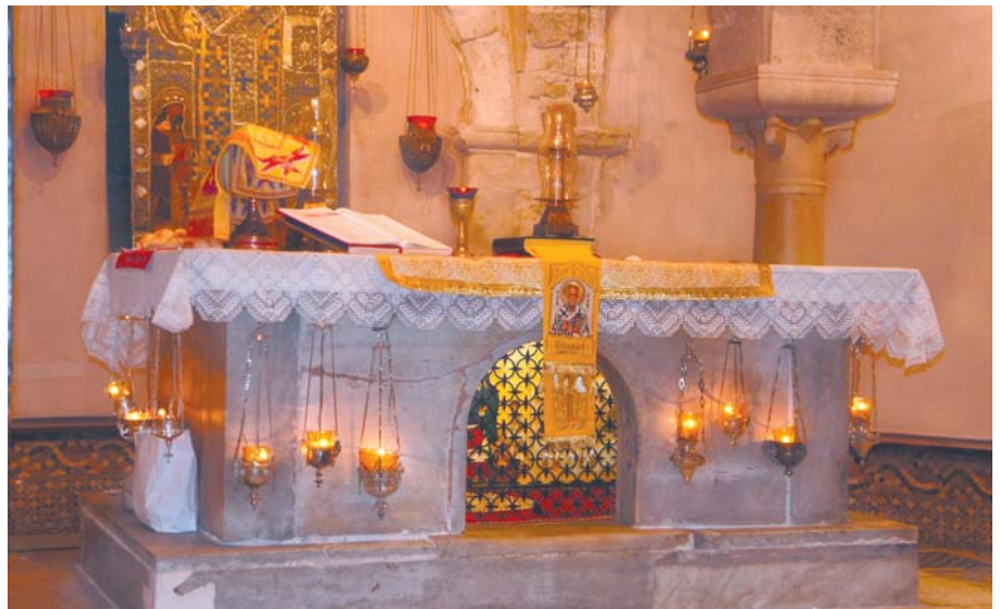
Надгробие св. Николая

Сейчас базилика принадлежит римско-католической Церкви; в крипте (нижнем древнем храме) имеется придел румынской православной Церкви. Рака с мощами находится в 1 м под землей, над ней сооружен мраморный престол в виде гробницы. Хотя крипта располагается значительно ниже уровня моря, во время частых наводнений вода чудесным образом не попадает к мощам. Русское православное духовенство служит здесь только во время паломнических поездок. За последние несколько лет, слава Богу, поток паломников из России начал снова возрастать, – с этим местные служители связывают чудесный факт увеличения количества благодатного мира.