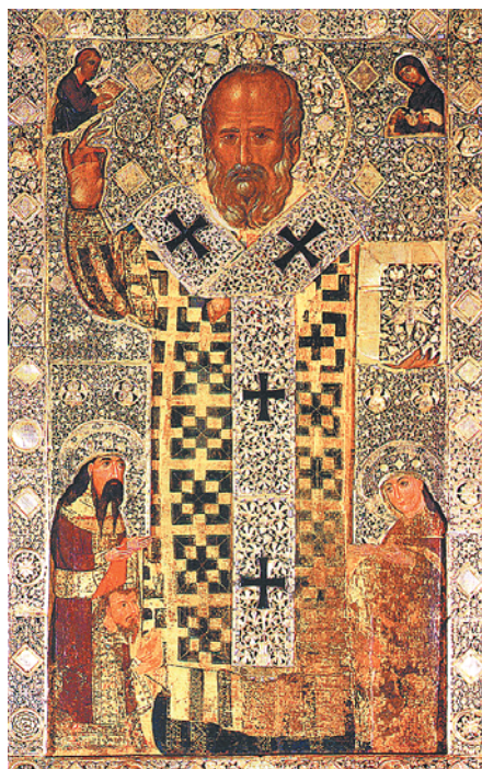
Образ Святого Николая – византийская икона 14-го века из крипты (нижнего храма) Базилики св. Николая в г. Бари. Икона находится за мраморным надгробием, под которым покоятся мощи св. Николая

Когда св. Николай отправился в паломничество в Святую Землю, корабль, на котором он плыл, попал в сильную бурю. Один из матросов сорвался с мачты и разбился насмерть. Но верующему все возможно: по молитвам святителя буря умиралась, а матрос был поставлен живым. На обратном пути св. Николай заметил, что капитан направляет корабль не в ту сторону, куда надлежит. Кротчайший пресвитер бросился ему в ноги, умоляя вернуть его на родину, но злонамеренный капитан нисколько не тронулся этой просьбой. Внезапно поднялся