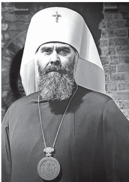
Митрополит Суражский Антоний

Слово, произнесенное на литургии в день памяти святителя Николая 19 декабря 1973 г., в храме его имени, что в Кузнецях