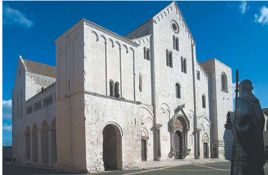
Базилика в городе Бари.

и после своей кончины. Заступник во всех бедах, он помогал, по великому милосердию своему, и малое моление приносящим, подавая им «великих недугов исцеление».